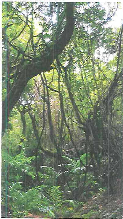
Foto 6. Selva tropical en el Cerro de las Cabras