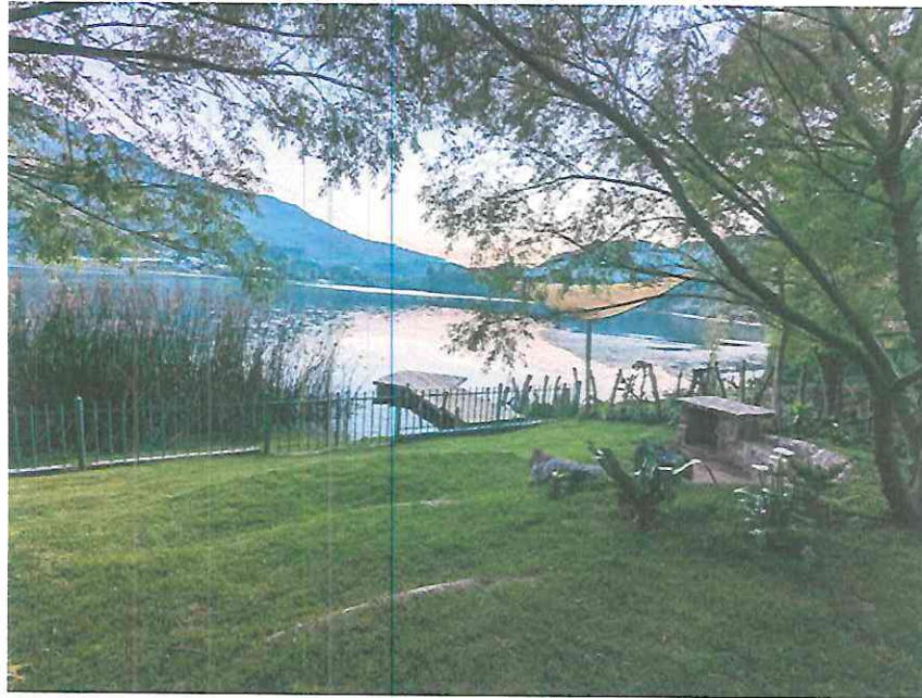
Foto 5 . Laguna Calderas desde la Sede de producción