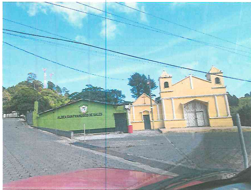
Foto 1. Iglesia de la aldea San Francisco de Sales