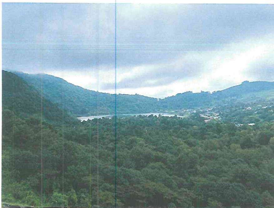
Foto 2. Laguna Calderas desde San Antonio el Pepinal