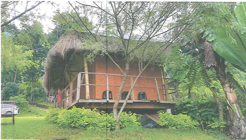
Foto 4. Sede de producción en Laguna Calderas