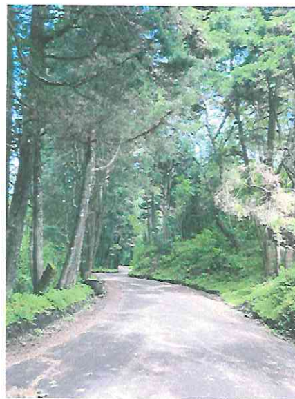
Foto 7. Camino al Cerro Negro